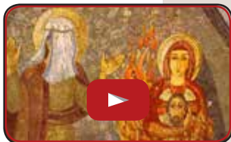
Carmelo Tonino Saia