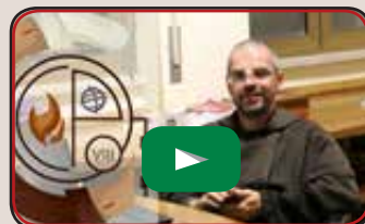
Riflessioni e testimonianze