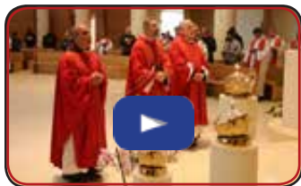
Collegio San Lorenzo