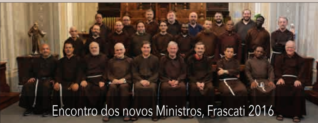
Encontro dos novos Ministros, Frascati 2016