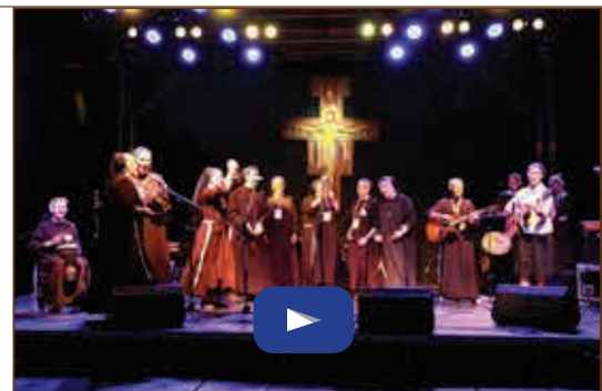
Vila Franciscana - 30 min.