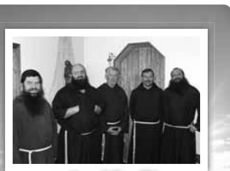
...i na Islandii