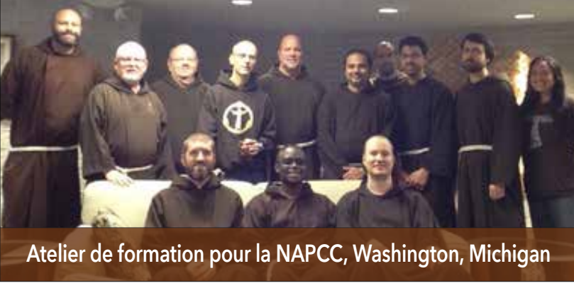
Atelier de formation pour la NAPCC, Washington, Michigan