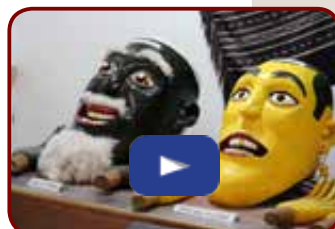
Berastagi, le musée