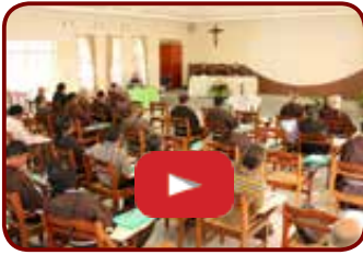
PACC n 1