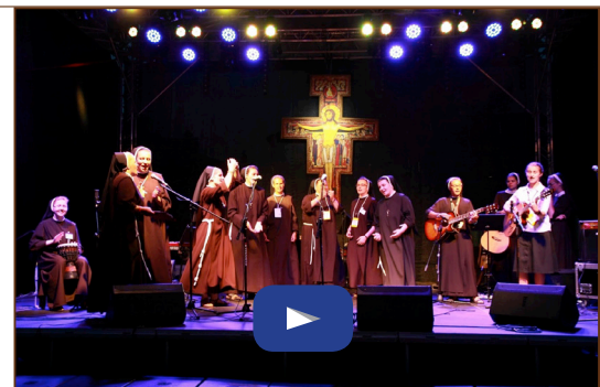
Vila Franciscana - 30 min.