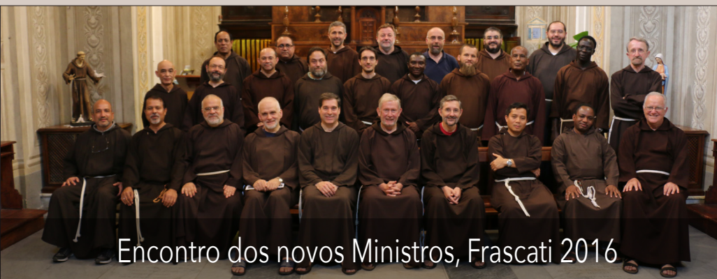
Encontro dos novos Ministros, Frascati 2016