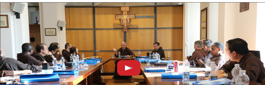
Foto - Encontro dos novos Ministros, Frascati 2016

Video - Encontro dos novos Ministros, Frascati 2016