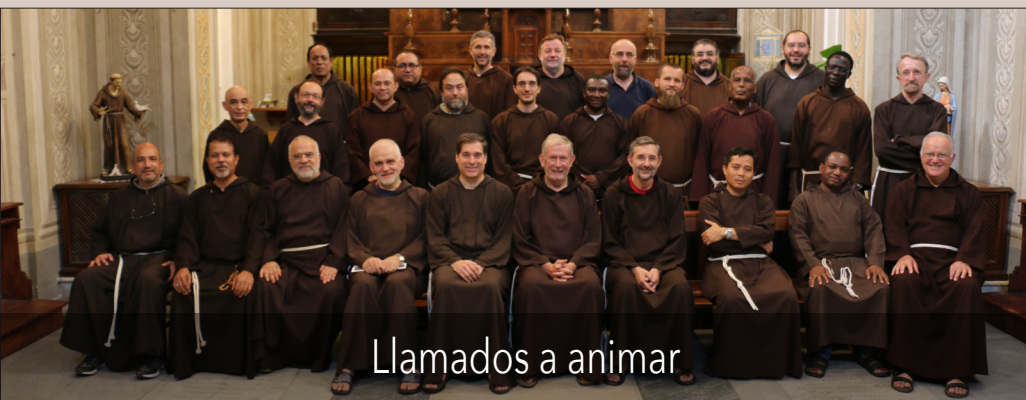
Llamados a animar