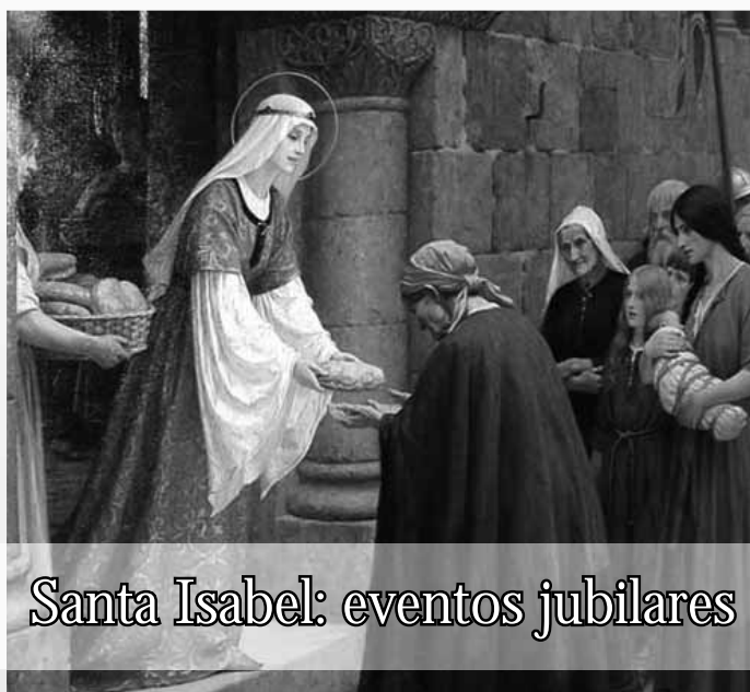
Santa Isabel: eventos jubilares