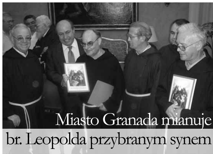
Miasto Granada mianuje br. Leopolda przybranym synem