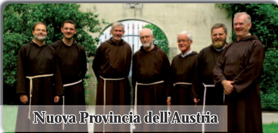
Nuova Provincia dell'Austria

Curia Generale OFMcap Via Piemonte, 70 00187 Roma · Italia Tel. 0039.06.4620121 Fax 0039.06.4828267 E-mail: bici@ofmcap.org