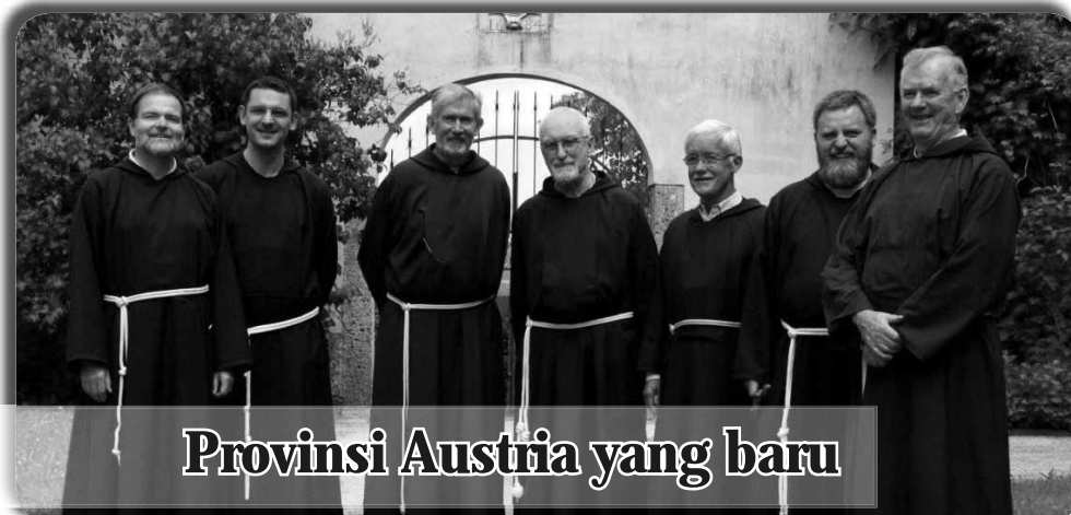
Provinsi Austria yang baru

Curia Generale OFMCap Via Piemonte, 70 00187 Roma · Italia Tel. 0039.06.4620121 Fax 0039.06.4828267 E-mail: bici@ofmcap.org