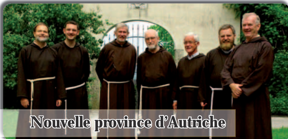
Nouvelle province d'Autriche

Curia Generale OFM Cap Via Piemonte, 70 00187 Roma · Italia Tel. 0039.06.4620121 Fax 0039.06.4828267 E-mail: bici@ofmcap.org