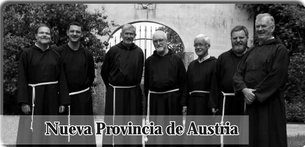
Nueva Provincia de Austria

Curia Generale OFMCap Via Piemonte, 70 00187 Roma · Italia Tel. 0039.06.4620121 Fax 0039.06.4828267 E-mail: bici@ofmcap.org