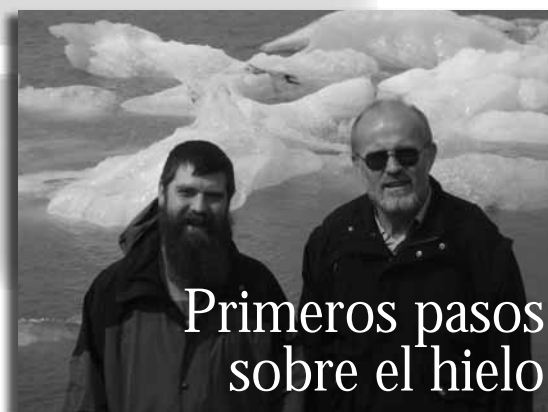
Primeros pasos sobre el hielo