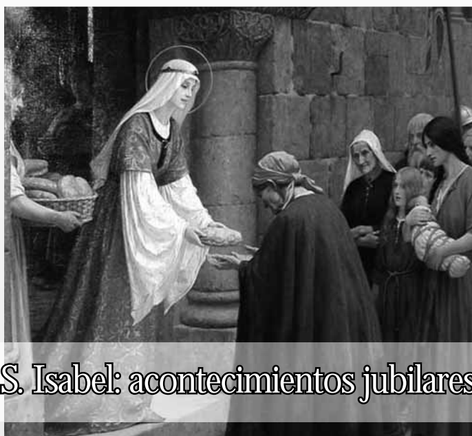
S. Isabel: acontecimientos jubilares