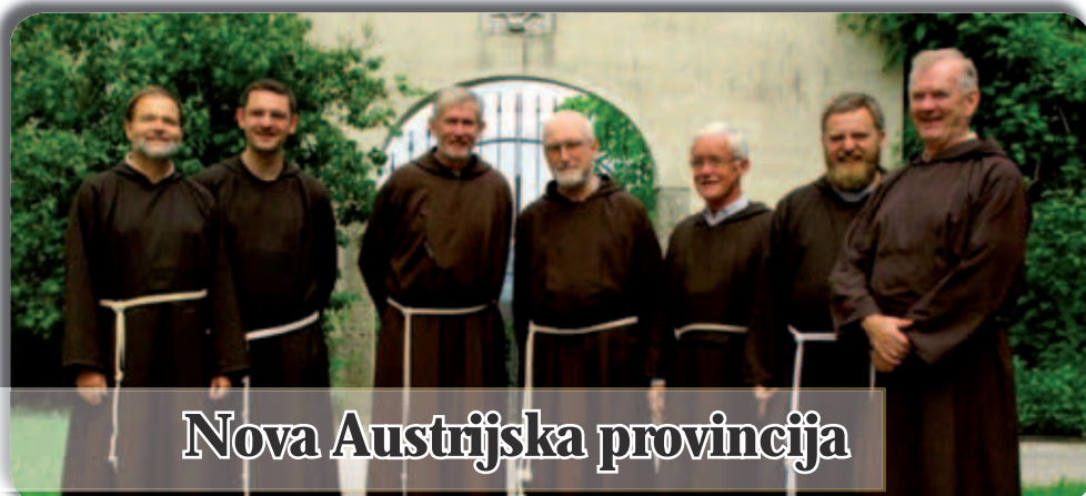
Nova Austrijska provincija

Curia Generale OFMConv Via Piemonte, 70 00187 Roma · Italia Tel. 0039.06.4620121 Fax 0039.06.4828267 E-mail: bici@ofmconv.org