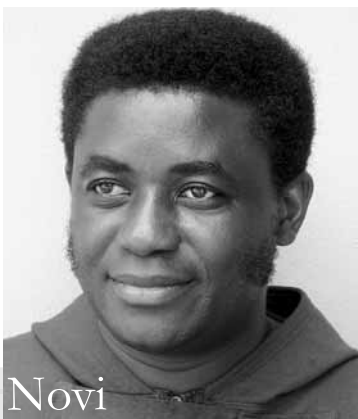
Novi biskup Mbula-a

Vatikan – Sveti Otac Benedikt XVI. imenovao je biskupa Mbula-a (Tanzanija) fra Beatusa Kinayaiya, nekoć provincijala Tanzanijske provincije. Beatus Kinayaiya rođen je 9. svibnja 1957. u Shimbwe u biskupiji Moshi. Nakon završenih studija u Sjemeništima Maua-i i Itaga-i završio je novicijatu u Kapucinskom redu u Basiti i položio doživotne zavjete 5. lipnja 1988. Studirao je filozofiju u Kibosho Senior Seminary i teologiju u St. Chares Lwanga Segerea Senior Seminary. Za svećenika je zaređen 25. lipnja 1989. Završio je mješovite studije (povijest, zemljopis i filozofiju) na Sveučilištu u Londonu. Nakon ređenja vršio je sljedeće službe: 1989.-1992. vice rektor i predavač u Sjemeništu u Maua-u; 1996.-1999. rektor Sjemeništa u Maua-u; 1999.-2005. provincijalni ministar Tanzanijske provincije; predsjednik kapucinske Konferencije viših poglavara (EACC); predsjednik udruženja redovnički poglavara Tanzanije (R.S.A.T). Trenutno se nalazio u Rimu gdje je provodio „subotnju godinu“ i studirao duhovno bogoslovlje na Papinskom sveučilištu Antonianum ●