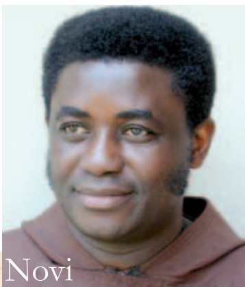
Novi biskup Mbulu-a

Vatikan – Sveti Otac Benedikt XVI. imenovao je biskupa Mbulu-a (Tanzanija) fra Beatusa Kinayaiya, nekoć provincijala Tanzanijske provincije. Beatus Kinayaiya rođen je 9. svibnja 1957. u Shimbwe u biskupiji Moshi. Nakon završenih studija u Sjemeništima Maua-i i Itaga-i završio je novicijatu u Kapucinskom redu u Basiti i položio doživotne zavjete 5. lipnja 1988. Studirao je filozofiju u Kibosho Senior Seminary i teologiju u St. Chares Lwanga Segerea Senior Seminarij. Za svećenika je zaređen 25. lipnja 1989. Završio je mješovite studije (povijest, zemljopis i filozofiju) na Sveučilištu u Londonu. Nakon ređenja vršio je sljedeće službe: 1989.-1992. vice rektor i predavač u Sjemeništu u Maua-u; 1996.-1999. rektor Sjemeništa u Maua-u; 1999.-2005. provincijalni ministar Tanzanijske provincije; predsjednik kapucinske Konferencije viših poglavara (EACC); predsjednik udruženja redovnički poglavara Tanzanije (R.S.A.T). Trenutno se nalazio u Rimu gdje je provodio „subotnju godinu“ i studirao duhovno bogoslovlje na Papinskom sveučilištu Antonianum ●